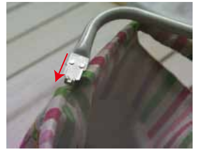
② 金具の向きに注意!! 口布にニュームカンを通す