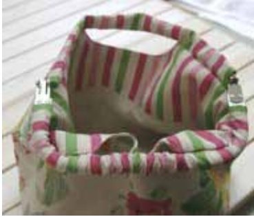
③ 片方の金具が通ったところ