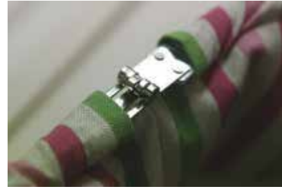
⑤ つなぎ目がまっすぐになるように金具をあわせる