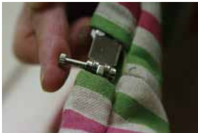
⑥ 長いネジを外側から入れる