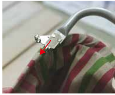
④ もう一方の金具を入れる