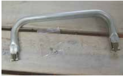
① 袋に入っているもの