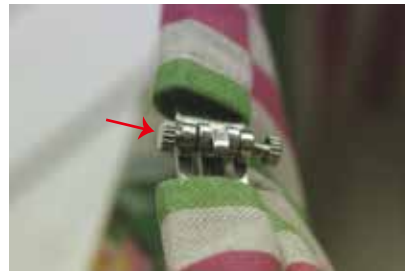
⑦ 短いネジを内側から入れ止める (反対側のネジも⑤、⑥の手順で止める)