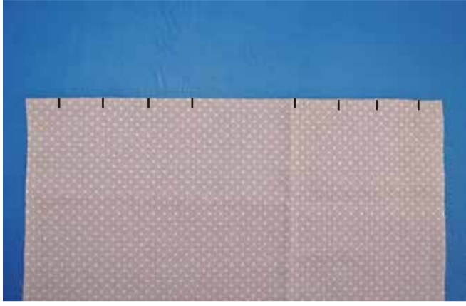
① タックの位置に印を付ける