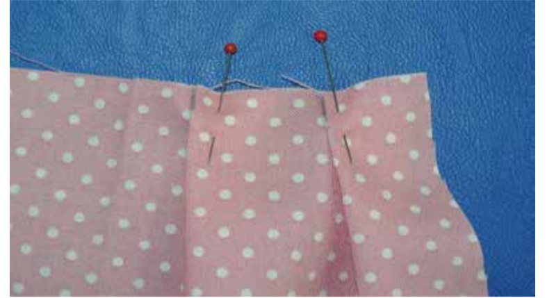
斜線の高い方をつまみ低い方に合わせる