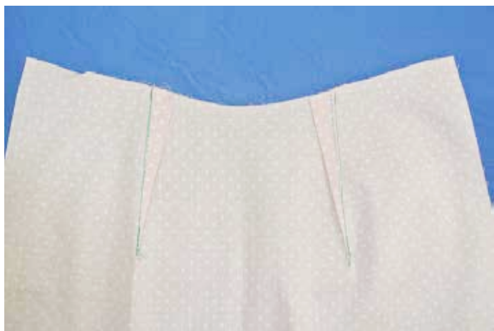
④ダーツをアイロンで倒す