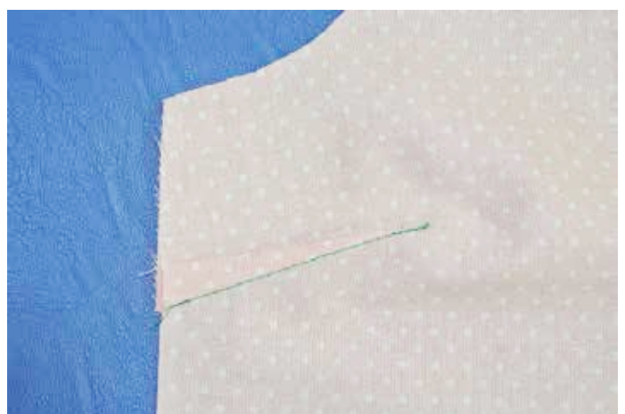
④-2バストダーツは上側向けてに倒す