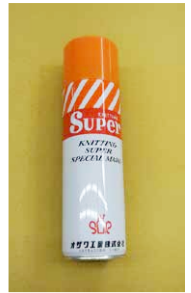
シリコンスプレーは滑りを良くするために針と糸に少量かけると縫いやすくなります