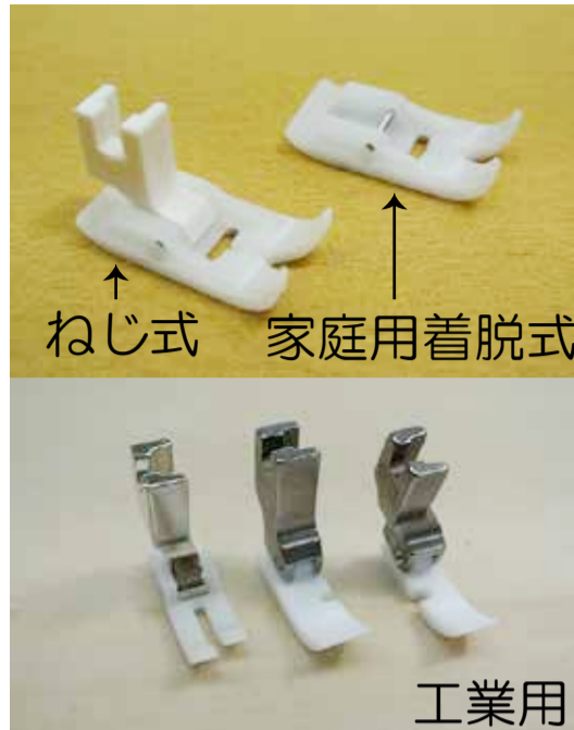
テフロン押さえ金を使うと縫いやすくなります 家庭用・工業用があります (家庭用はメーカーを確認してからご購入下さい)