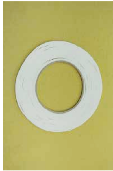
まち針やアイロンを使えない為しつけテープ(3mm巾)を使います