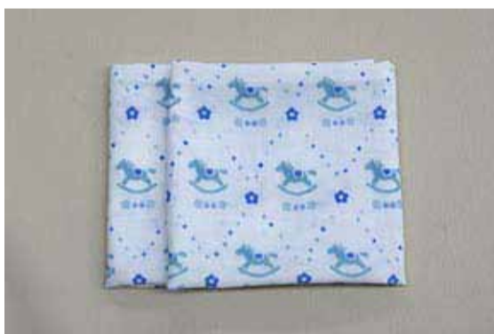
③型紙の④の線で折り⑤の線で折り重ねる