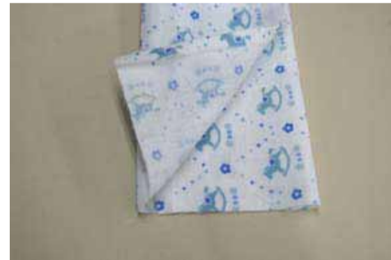
②①で折った面を上にして3つにたたむ