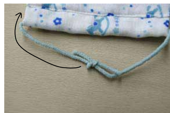
⑥結び目は中に入れる