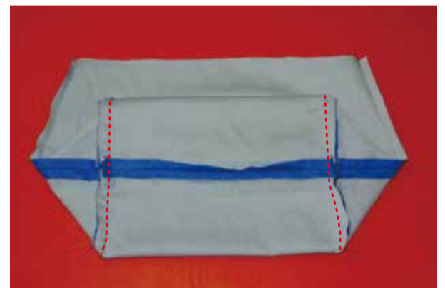
④-2 マチを広げ縫う (2ヶ所)