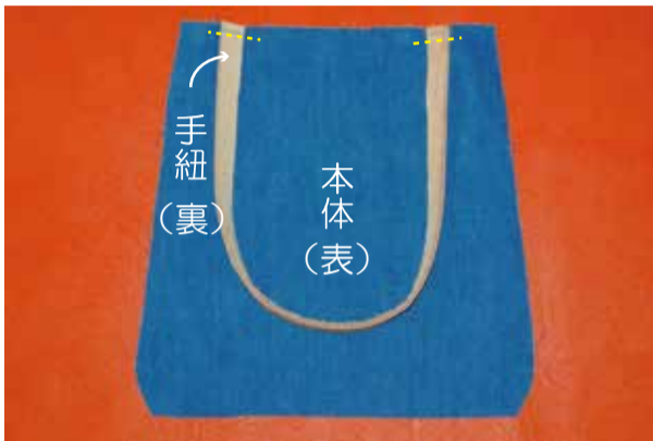
① 手紐を仮止める 手紐を本体上の手紐付け位置に仮止める (2組)

※接着芯を使用する場合は、表地と同じ大きさに裁断して表地の裏に貼ります (芯を貼ります) の表記は接着芯を貼る場合の目安ですが、生地のお好みにより、貼らなくても制作できます