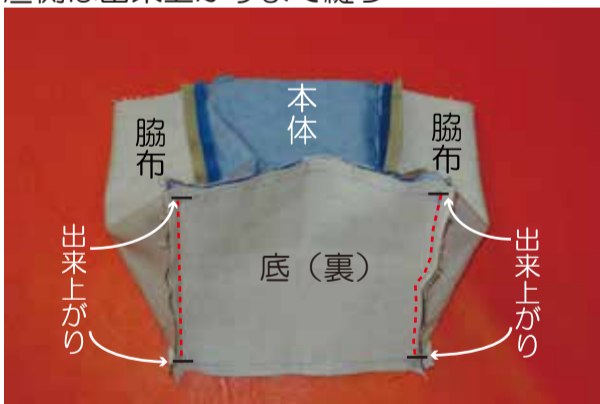
③-1 ②の脇マチと底を中表に合わせ、出来上がりまで縫う (2辺)