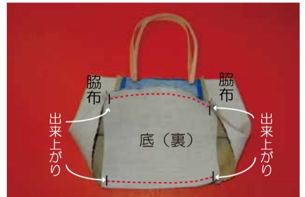
③ 底を縫う ③-1 ②の本体と底を中表に合わせ、出来上がりまで縫う (2辺)