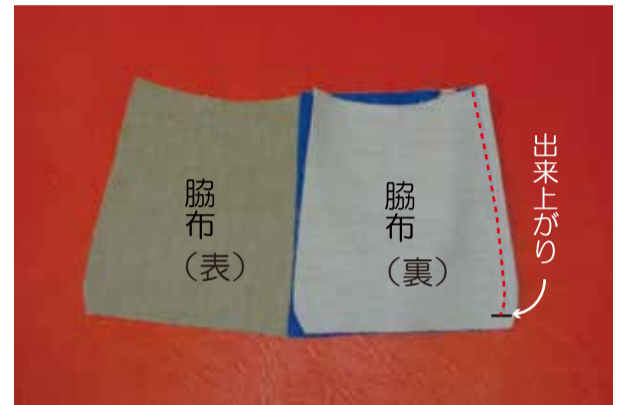
②-2 反対側の脇マチも同様に縫う