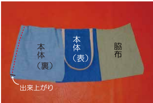
②-3 もう片側の本体表を脇マチと中表に合わせ、口側は縫代まで、底側は出来上がりまで縫う