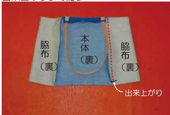
②-4 反対側の脇マチも同様に縫う (縫代は4ヶ所ともアイロンで割る)