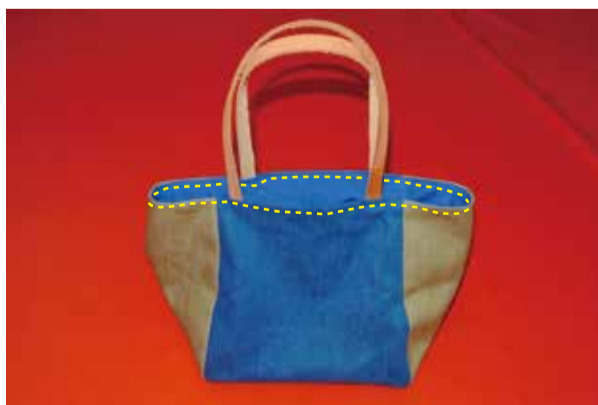
⑥ 口にステッチする 裏の返し口から表に返し、口を出れに折り、ステッチする