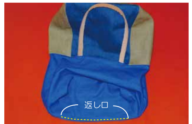
⑦ 返し口縫う 裏地の返し口を出来上りに折り、縫う