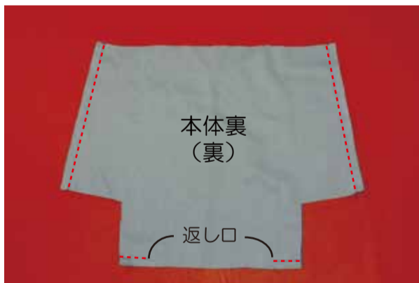
④ 裏地を縫う ④-1 裏地を中表に合わせ、脇(2ヶ所)と底を縫う (底に返し口を開けておく)