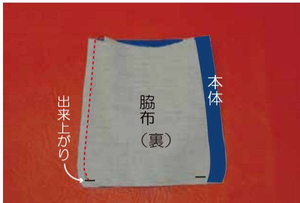
② 本体と脇布を縫う ②-1 本体表と脇マチを中表に合わせ、口側は縫代まで、底側は出来上がりまで縫う