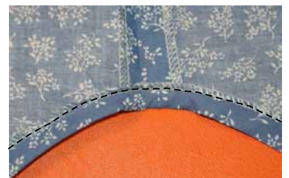
⑧ 裾の始末をする 縫代の始末をして出来上がりに折り上げ縫う