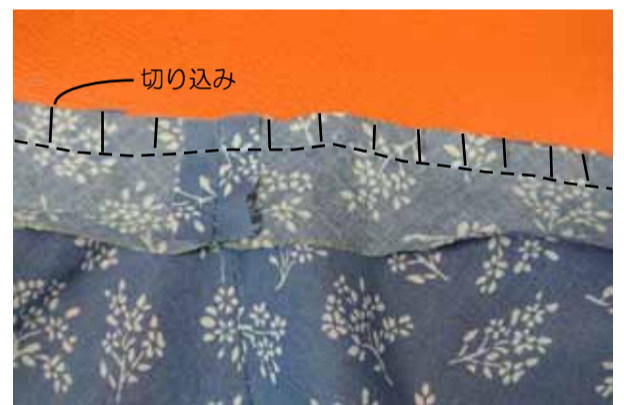
④-4 縫代を0.5cmに切り落とし切り込みを入れる