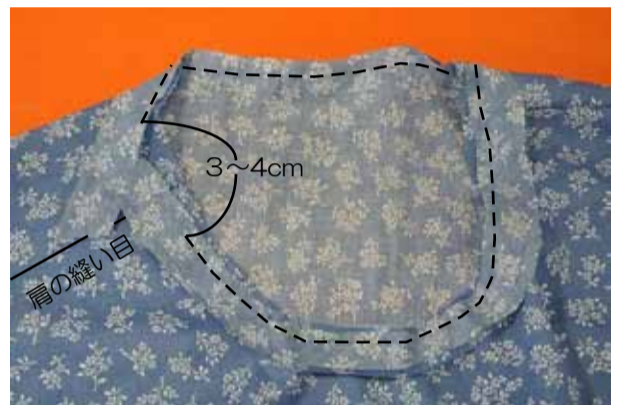
④ 衿ぐりの始末をする ④-1 衿ぐりとバイアステープを中表に合わせて肩の縫い目より3~4cm手前まで縫う