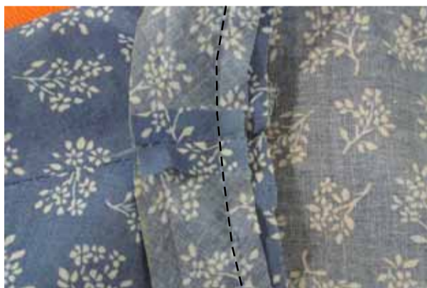
④-3 残りの衿ぐりを縫う