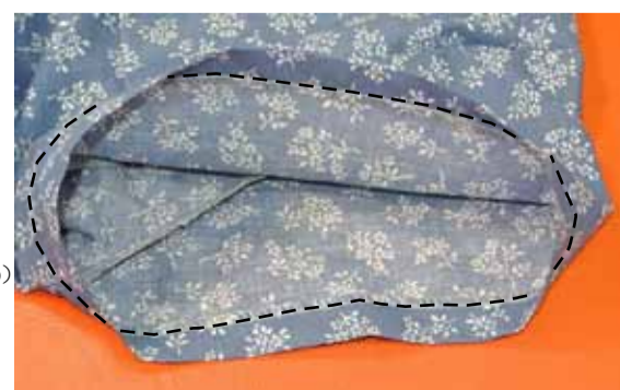
⑦ 袖口の始末をする 縫代の始末をして出来上がりに折り上げ縫う