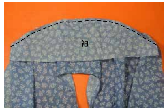
⑤ 袖を付ける 身頃の袖ぐりと袖を中表に合わせて縫う