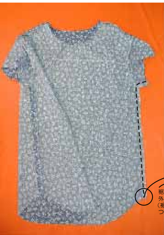
⑥ 袖から脇を縫う 前後身頃を中表に合わせて袖口から脇を続けて縫い縫代をアイロンで割る