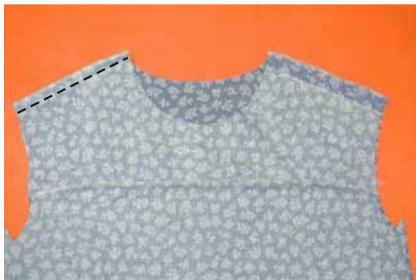
③ 肩を縫う 前後身頃を中表に合わせて肩を縫い、縫代をアイロンで割る