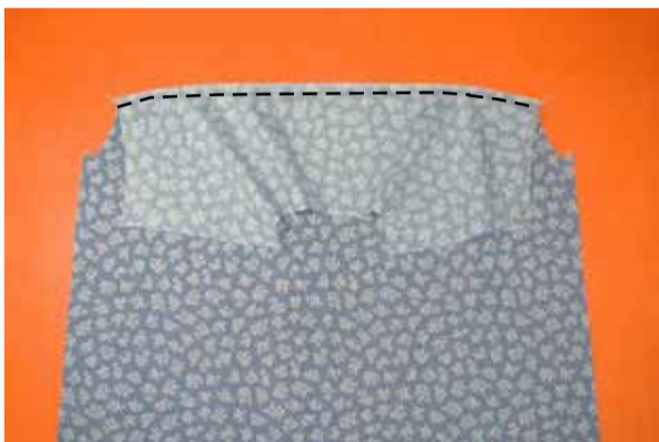
② 身頃とヨークを縫う 前後身頃と前後ヨークをそれぞれ中表に合わせて縫い、縫代をヨーク側に倒す

前後ヨークをニットで作る場合は前身頃の肩にニット芯の縦地 (縫代巾+0.5cm) A 衿ぐりにニット芯の横地 (縫代巾) を裏側に貼る B (上図参照)