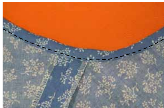
④-5 バイアステープを裏側に返して縫う